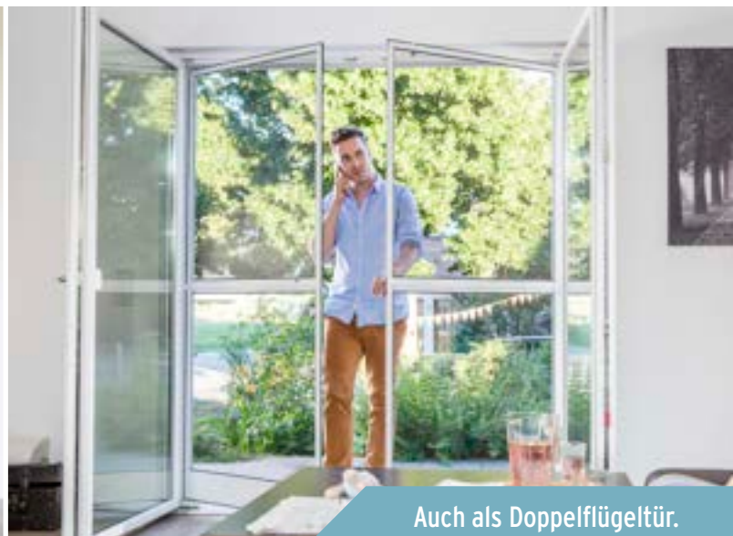
Auch als Doppelflügeltür.