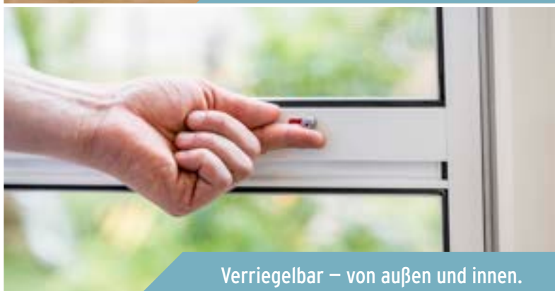
Verriegelbar – von außen und innen.