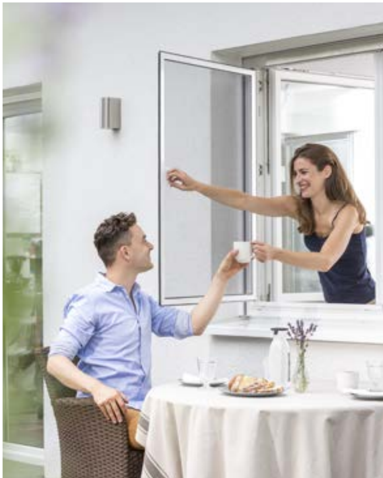
In beide Richtungen öffnen – das Pendelfenster.