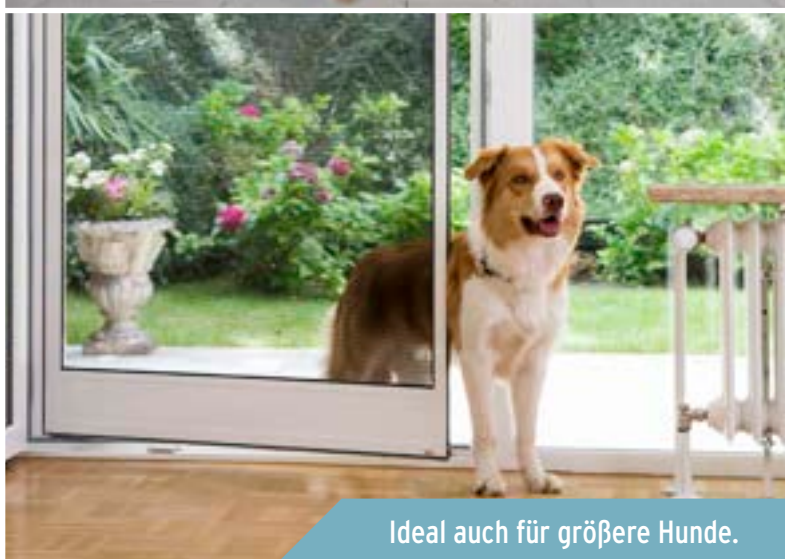
Ideal auch für größere Hunde.