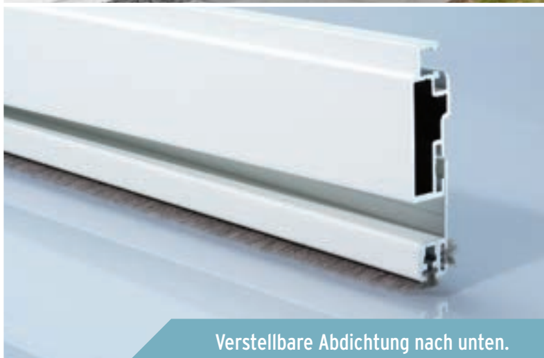
Verstellbare Abdichtung nach unten.